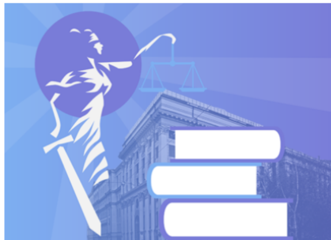
ИЛЛЮСТРАЦИЯ: ПРАВО.RU/ПЕТР КОЗЛОВ

С 13 по 17 сентября Верховный суд рассмотрит 72 дела. Три судьи попытаются убедить админколлегию, что их зря выдали следователям. СКЭС решит, с какого момента инвестор может пользоваться налоговой льготой. Но больше всего интересных дел в «гражданской» коллегии. Там врач-целевик снова спорит с больницей, ФНС отстаивает «субсидиарку» после исключения компании из ЕГРЮЛ, а неправомерно оштрафованный водитель взыскивает с МВД расходы на юриста.